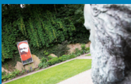
Der Garten des Museums Karl-Marx-Haus