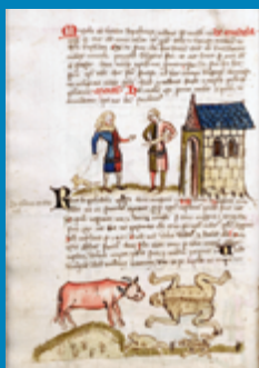
Äsop/Avian, Fabulae. Eine Bilderhandschrift für den Schulgebrauch. Entstehung: Trier, Abtei St. Matthias, um 1380