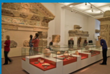
Entdecken – Bewahren – Erforschen: Blick in die Dauerausstellung