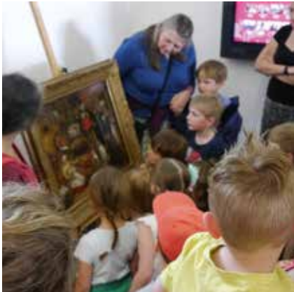
Foto: Buntes Programm für Groß und Klein im Stadtmuseum © Stadtmuseum Simeonstift