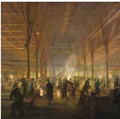
Foto: Otto Bollhagen, Tiegelstahlguss bei Krupp, 1912 © Historisches Archiv Krupp, Essen