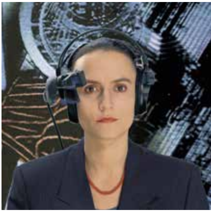
Foto: Hermann Stamm, Ingenieurin, aus: »Die Vision von der eingeholten Zukunft« © Museum am Dom