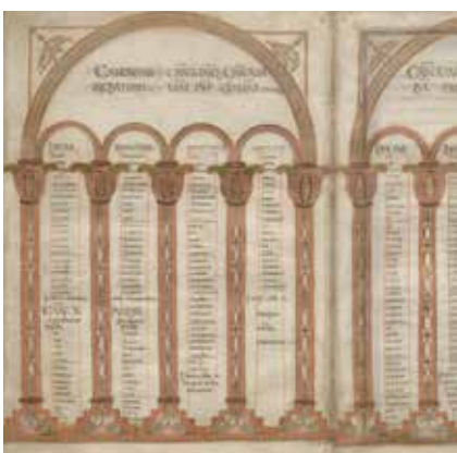
Foto: Kanontafel aus der Ada-Handschrift, Stadtbibliothek HS 22 folio 85v